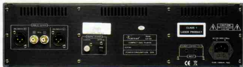
La sortie bénéficie de prises symétriques XLR, encore rares à ce prix

Les circuits numériques travaillant à haute fréquence ne sont pas perturbés par des interactions électromagnétiques. Le CD S-5 associe une mécanique Philips à un convertisseur Burr-Brown PCM1792 qui assure un décodage en 24 bits/192 kHz. La particularité de cette puce réside dans sa sortie symétrique, évitant ainsi que le signal soit désymétrisé en aval. D'ailleurs, le CD-S5 est nanti d'un authentique schéma symétrique. Lors de sa conception, les ingénieurs ont en outre mis l'accent sur l'utilisation de composants neutres n'altérant en rien l'intégrité du signal. Vous n'observerez donc que des références de première qualité, sélectionnées rigoureusement, comme des condensateurs Wima, Solen et Dale, ou les excellents amplificateurs opérationnels Burr-Brown OPA2604 et OPA2134. Pour que les gains apportés par la construction symétrique soient potentialisés, les ingénieurs de Vincent ont veillé à observer une parfaite séparation de la structure de traitement du signal, notamment au niveau de l'alimentation de l'étage courant tension. Ainsi tous les niveaux de tension sont stabilisés. La séparation des canaux est mainte-