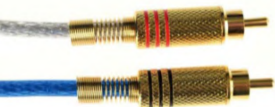
Gleich zwei koaxiale Digitalkabel liegen mit im Karton.

Doch gemacht. Schauen wir uns doch zuerst das Pflichtprogramm eines D/A-Wandlers an. Sechs Quellen finden Anschluss, das kann man an dieser Stelle gar nicht genug loben.