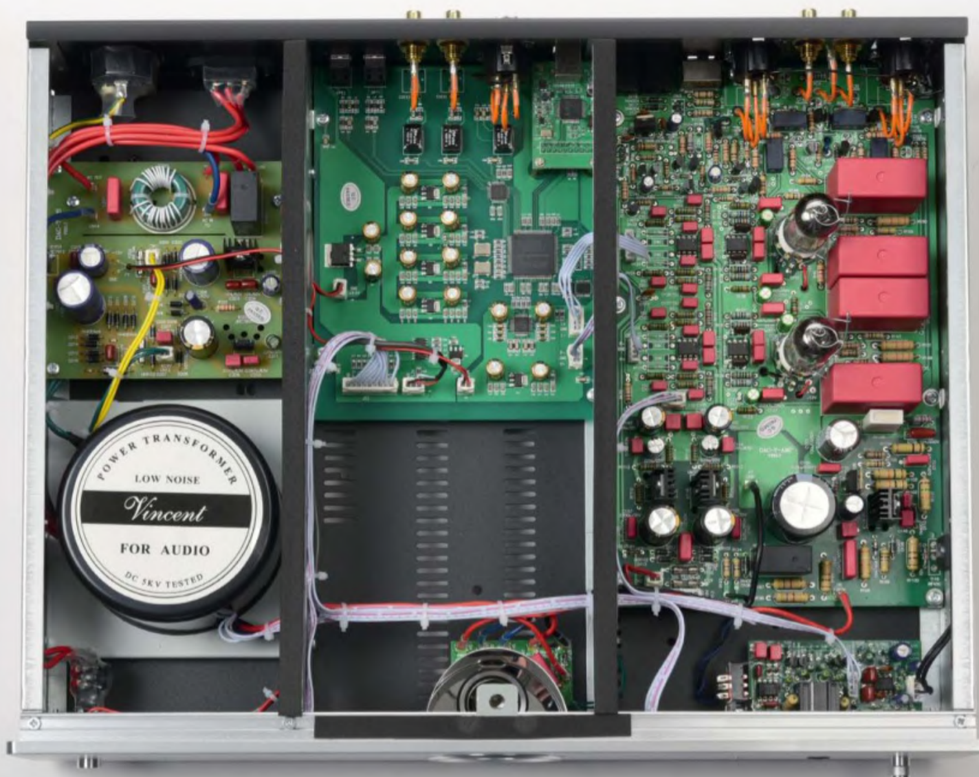
Hebt man den Deckel ab, wird der Preis noch nachvollziehbarer. Netzteil, digitale und analoge Platine sitzen in eigenen Abteilungen. Die Röhre hält zudem Abstand zur Digital-Platine.

wurden sehr sorgfältig ausgewählt. Eigentlich eine Selbstverständlichkeit, es sei hier nur der Vollständigkeit halber erwähnt.