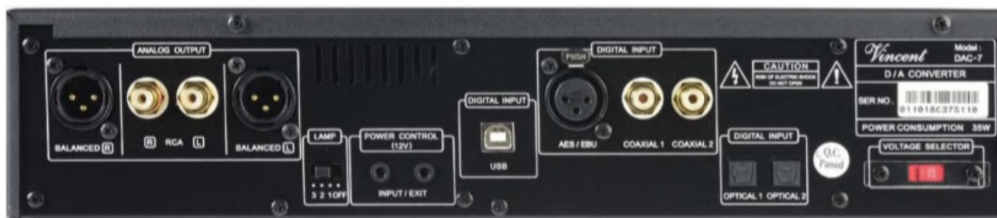
Die Rückseite ist angenehm üppig bestückt: Neben XLR- und Cinch-Ausgängen finden wir hier gleich sechs digitale Eingänge und den Schalter, der die Beleuchtung der Röhre regelt/ausschaltet.